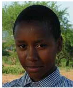
Patience 17 Jahre

Schicken Sie mir ein Mail oder drucken Sie den Patenschaftsantrag auf unserer Webseite aus und senden Sie mir den Antrag ausgefüllt und unterschrieben zurück.