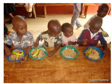
genascht wird auch