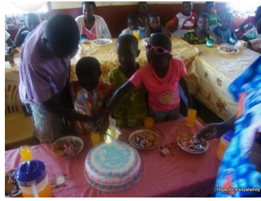
die Torte wird angeschnitten