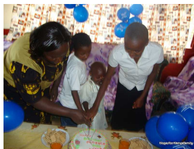
die Kinder schneiden ihre Torte an