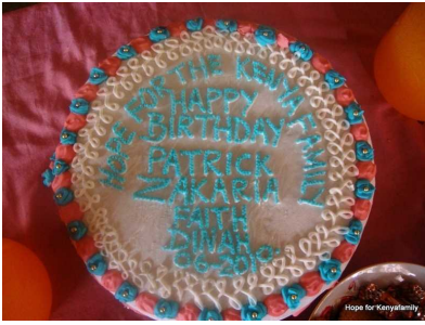
die Geburtstagstorte Monat Juni